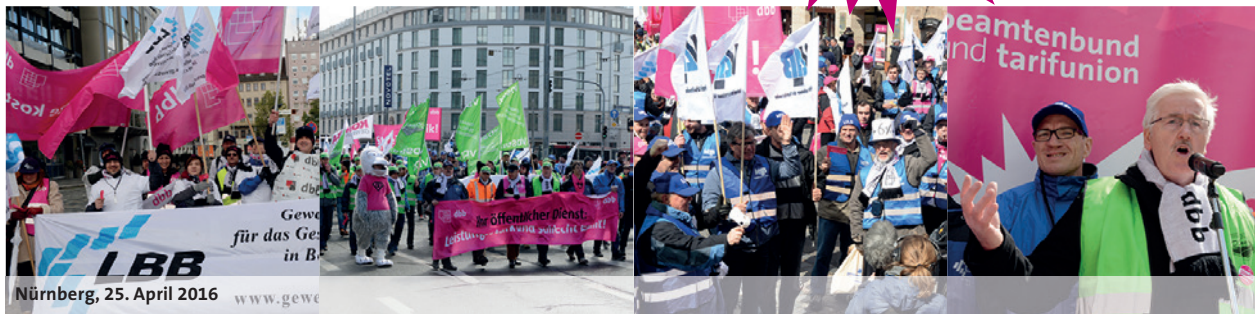
Nürnberg, 25. April 2016 www.gewe