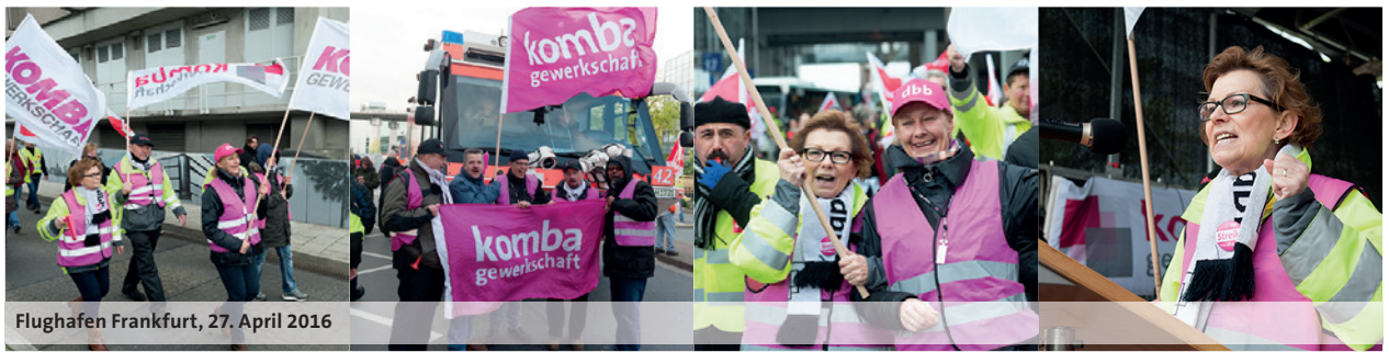
Flughafen Frankfurt, 27. April 2016